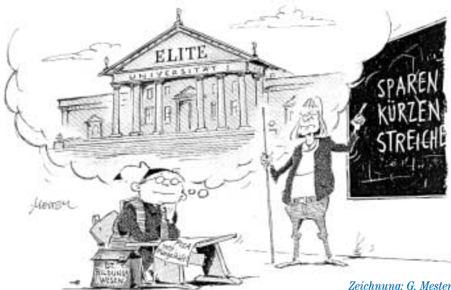
Zeichnung: G. Mester

Bärbel Rompeltien GEW-FG Hochschule und Forschung